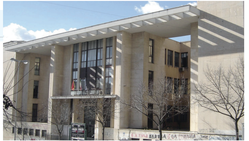
Sede di Viale Regina Margherita

In atto, l'Istituto M. Rapisardi fornisce una valida preparazione, sia per accedere al mondo del lavoro