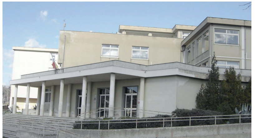
Sede di Via Filippo Turati

che per la prosecuzione degli studi universitari. I sei indirizzi di studio sono caratterizzati da discipline che forniscono competenze e saperi ritenuti fondamentali nella odierna realtà e tendono a formare figure professionali in grado di lavorare in ambienti che richiedono specifiche conoscenze ed abilità tecniche che si esprimono in diversi ambiti: giuridico - economico, marketing, pub-